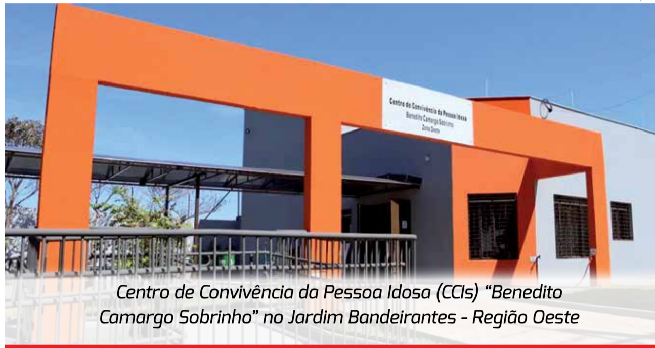
Centro de Convivência da Pessoa Idosa (CCIs) "Benedito Camargo Sobrinho" no Jardim Bandeirantes - Região Oeste

No CCI Norte, a festa será realizada no Centro Esportivo do Maria Cecília, em frente à unidade. A programação contará com apresentação do Trio Modão Sertanejo, dança da peneira com grupo do SESC Londrina Norte, além de quadrilha junina e brincadeiras tradicionais. Os participantes também participarão de um lanche compartilhado e terão à disposição pipoca, canjica e