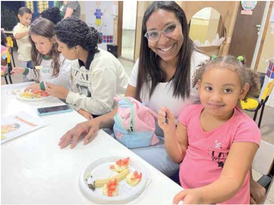
Nas atividades, famílias e crianças preparam pratos utilizando frutas presentes no cardápio escolar, apresentando alimentos e contribuindo positivamente na aceitação deles pelos alunos

O município de Cambé foi reconhecido com o Prêmio CAE de Participação Social, concedido pelo Programa Nacional de Alimentação Escolar (PNAE), do Ministério da Edu-